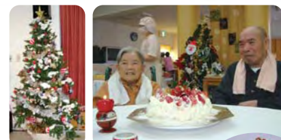
クリスマスケーキ作り